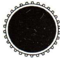
B JUMP MAT/Safety Net /Tied rope